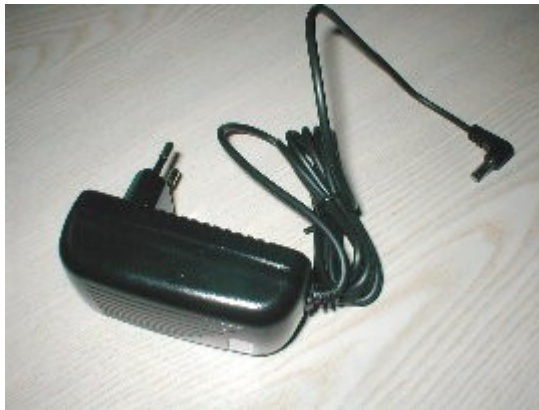
Optionales Stecker-Netzteil ( Kabellänge 1,8m )

Für Stations-Geräte mit eigener 230Volt-Versorgung kann auch ein Steckernetzteil zur Spannungsversorgung des Interfaces benutzt werden. (> 100mA)