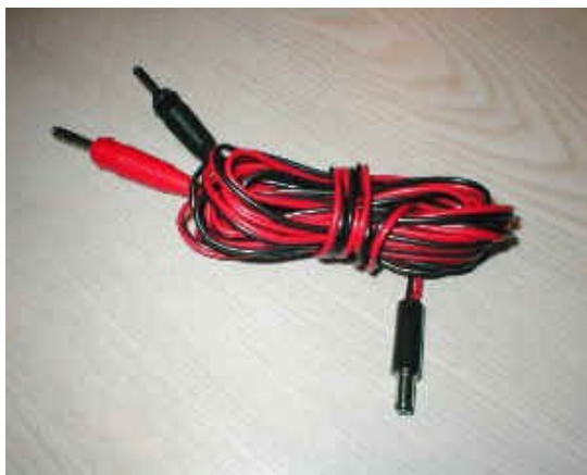
Optionales DC-Kabel ( 3m )

Beim Erwerb unseres Fertiggerätes wurde der für die Umschaltung integrierte Jumper ( 3p-rot ) bereits für das von Dir angegebene Funkgerät vorkonfiguriert. Für eine eventuelle Änderung ist er umzukonfigurieren.